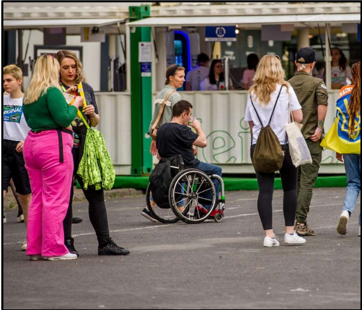
To zdjęcie grupy osób, którzy są na festiwalu.